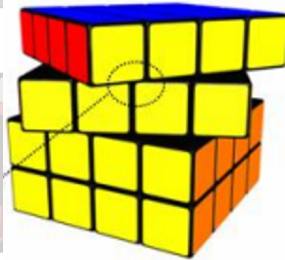
Figura 3. Ejemplo de cubo penalizado